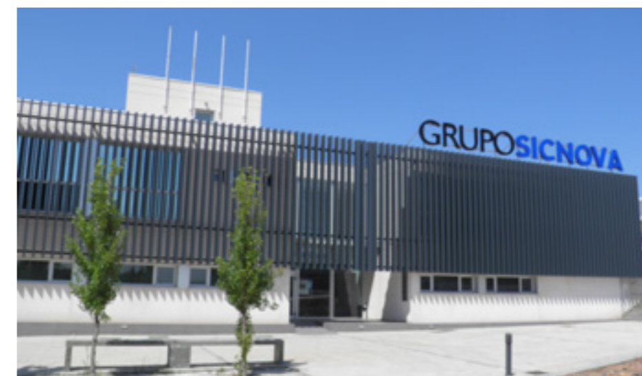
Imagen de la sede de la empresa Sicnova 3D.

Los modelos 3D tienen la suficiente rigidez y tenacidad para hacer operaciones de fresado, perforado y corte, sirviendo así como modelos de entrenamiento para cirugías o pruebas en distintas técnicas quirúrgicas. “De este modo se pueden obtener modelos 3D anatómicamente fieles y a escala real a partir de una imagen médica, para patologías traumatológicas, odontológicas-maxilofaciales, oncológicas o cardiológicas,