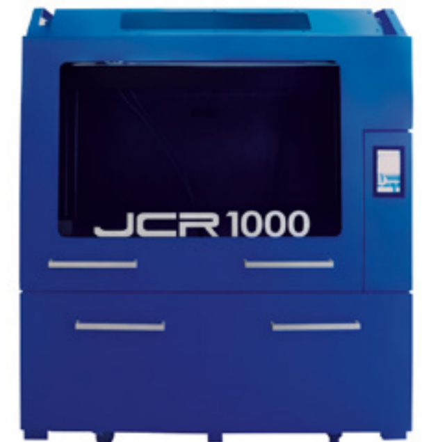
Equipo de impresión de la empresa.

Por ello las principales novedades en el futuro quizá no vengan tanto de la mano de nuevos avances en materia de hardware, sino sobre todo de las aplicaciones de la tecnología 3D en muchos procesos que hasta ahora se vienen desarrollando bajo métodos de producción tradicionales. "En la actualidad nos estamos dirigiendo a una digitalización plena de la fabricación. Al igual que ha ocurrido con otros sectores profesionales, la fabricación está sufriendo una transformación en sus procesos de