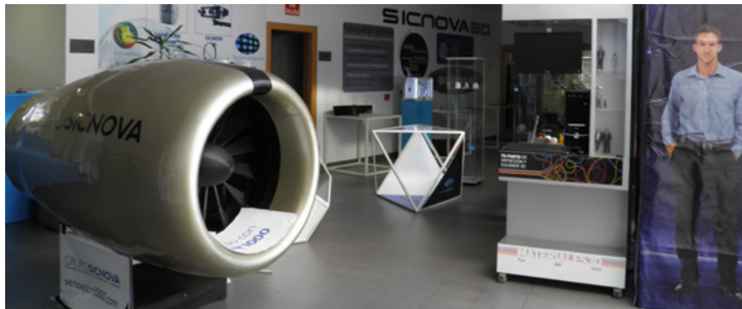
Taller de Sicnova 3D.

en España, pensada para industrias y profesionales que precisen de fabricación 3D en gran formato. "Un ejemplo de ello es el Centro Avanzado de Tecnologías Aeroespaciales (Fada-Catec) , que ha adquirido una de nuestras impresoras para el desarrollo de nuevas aplicaciones y soluciones de producción avanzada para el sector aeronáutico basadas en fabricación aditiva" comenta el empresario.