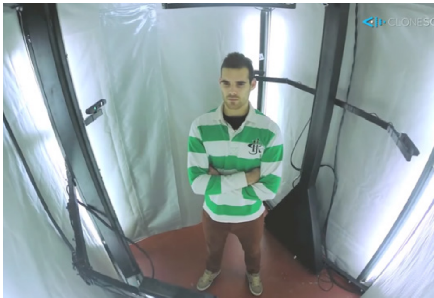
Interior del nuevo escáner Clonescan 3D, dedicado a biometría, control médico del peso corporal o confección de prendas a medida, entre otros usos.