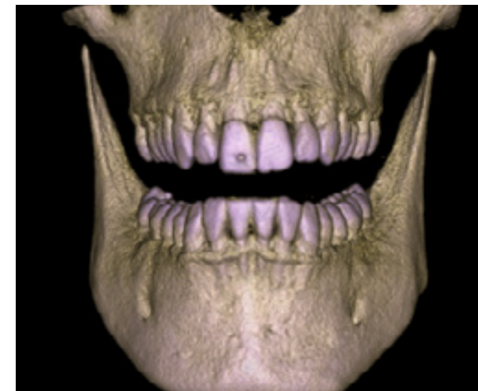
Imagen de impresión 3D.

Grupo Sicnova ofrece además servicios de impresión 3D para medicina, dirigidos a especialidades médico-