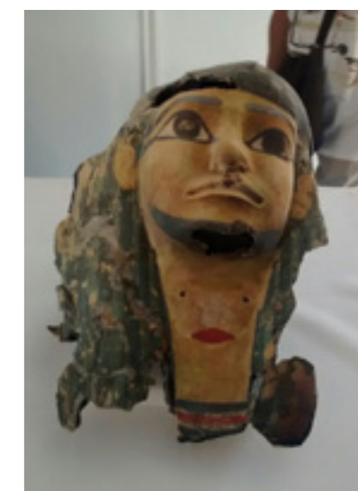
Impresión en 3D de una reconstrucción egipcia.