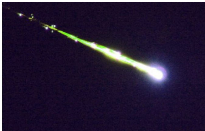
Bólido sobrevolando Granada.

A las 22.30 horas del 11 de diciembre de 2016, un bólido o bola de fuego atravesó a gran velocidad los cielos de Granada y Almería. Era una noche despejada. Lo más llamativo del suceso fue que produjo ruido. Se escuchó un estruendo debido a que el meteoro explotó antes de tocar tierra como consecuencia del impacto contra la atmósfera terrestre de un meteoróide a una velocidad aproximada de 72.000 km/h y a una altura superior a los 20 kilómetros.